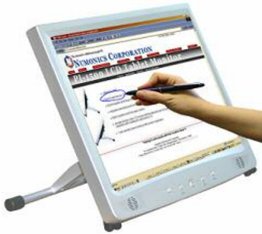
Intelli LCD-PenDisplay 1500

Die wohl ergonomischste Dateneingabe am Computer Mit dem interaktiven LCD PenDisplay arbeiten Sie nicht vor, sondern direkt auf dem Bildschirm