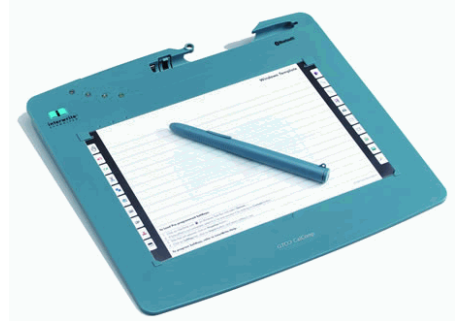
Drahtloses Bluetooth SchreibPad

Mobile Minitafel. Zusammen mit einem Projektor verwandelt Sie jede beliebige Projektionsfläche in eine interaktive Bildwand. Im Klassenraum, in der Aula oder unterwegs. Für die Unterrichtsvorbereitung im Lehrerzimmer oder zu Hause ersetzt das SchreibPad die Maus.